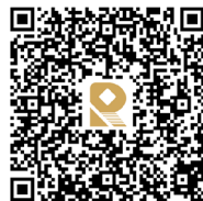
外贸贴息政策专项

凡在以下银行机构的云南省内各级网点办理符合支持范围的贷款，可通过“外贸贴息政策专项工作项目”实现“免申即享”，具体要求可与客户经理对接。纳入外贸贴息政策专项工作范围内的银行机构包括：中国进出口银行、国家开发银行、中国农业发展银行、中国工商银行、中国邮政储蓄银行、中国银行、交通银行、中国农业银行、中国建设银行、兴业银行、平安银行、上海浦东发展银行、中国民生银行、中信银行、渤海银行、光大银行、华夏银行、招商银行、广发银行、恒丰银行、曲靖市商业银行、云南红塔银行、富滇银行、云南省农村信用社。