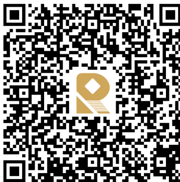
外贸贴息政策专项